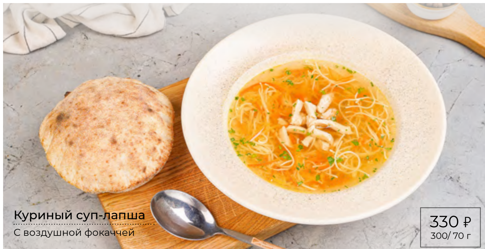
Куриный суп-лапша С воздушной фокаччей