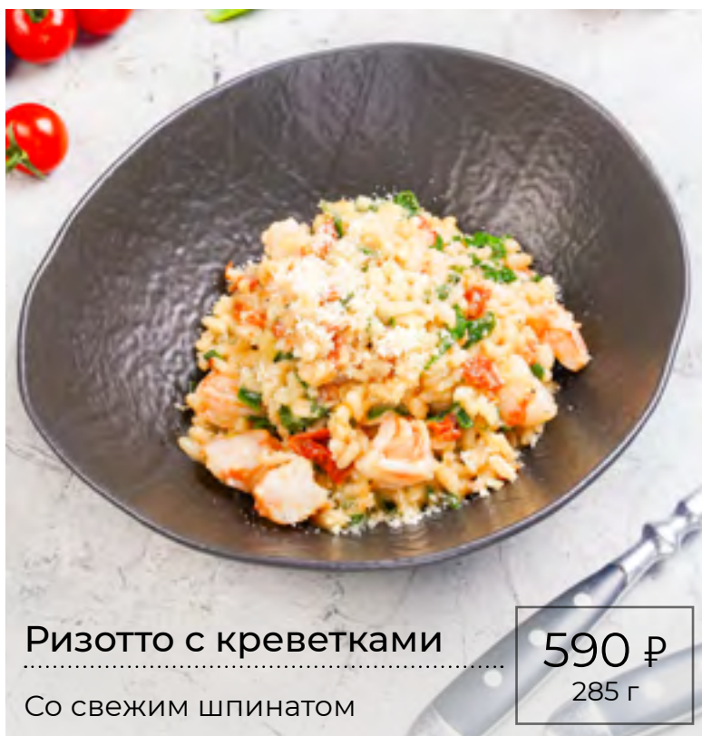
Ризотто с креветками