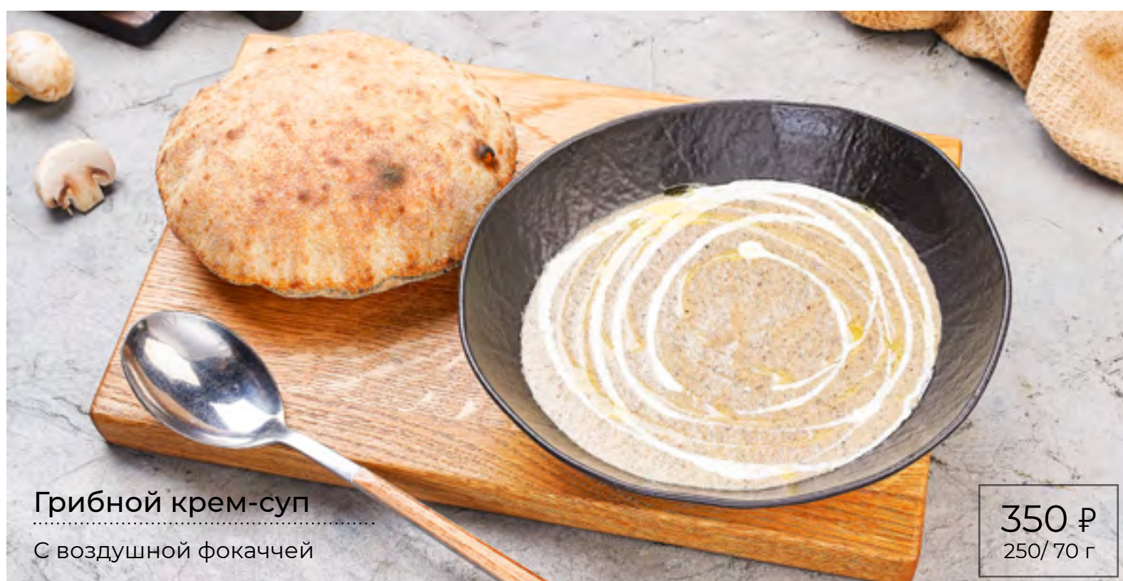
Грибной крем-суп С воздушной фокаччей