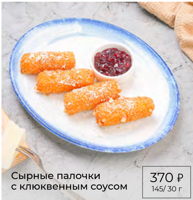
Сырные палочки с клюквенным соусом