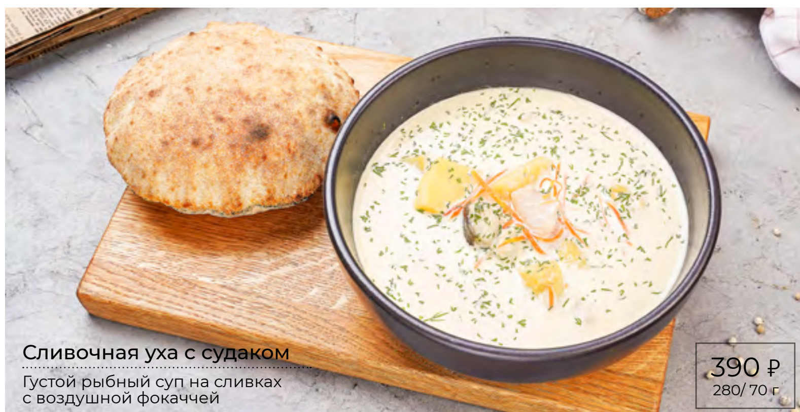
Сливочная уха с судаком Густой рыбный суп на сливках с воздушной фокаччей