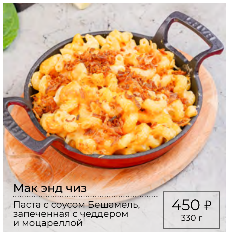
Мак энд чиз

Паста с соусом Бешамель, запеченная с чеддером и моцареллой